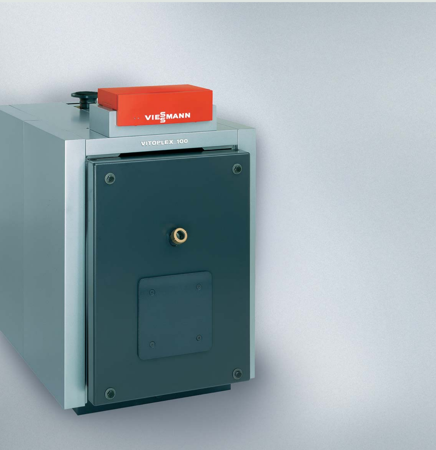
Vitoplex 100 Cazan din oțel pe combustibil lichid sau gazos