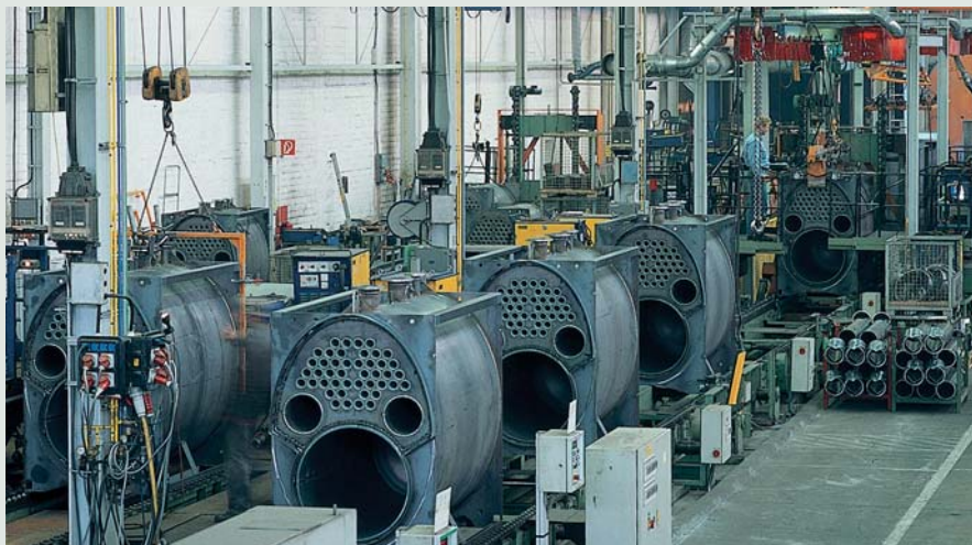
Procese de fabricație moderne

Un avantaj al cazanului Vitoplex 100 este modul de construcție compact, care permite amplasarea cazanului și în spații restrânse, cu acces dificil.